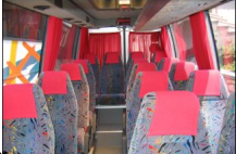
Mercedes-Benz Sprinter 416