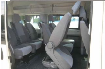
Volkswagen Transporter TDI 4Motion