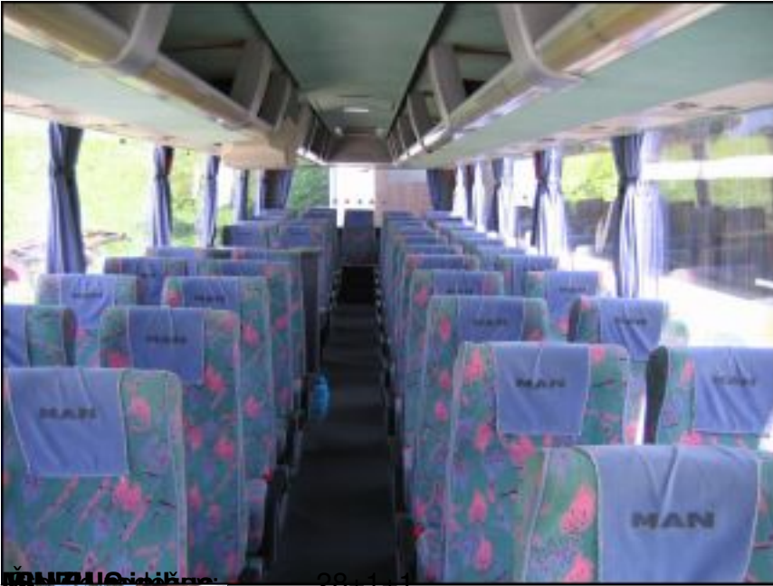
MAN Lion's Coach 28+1+1

Petek, 05. marec 2010 11:39 - Zadnjič posodobljeno Četrtek, 11. april 2013 20:10